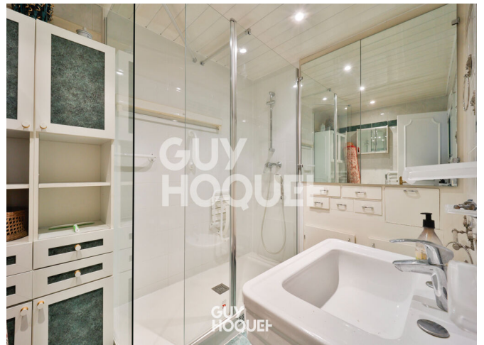
Photo du bien